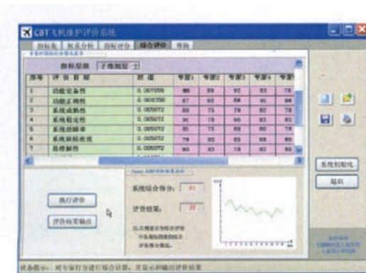
图 3 CBT 飞机维护评价系统界面 Fig.3 Interface of CBT aircraft maintenance evaluation system

评价软件按文中的描述建立了 CBT 系统评价因素集, 且允许系统管理员按层次法原理修改和补充评价的层次及其评价指标; Fuzzy AHP 模块依据文中的数学模型编制了数据处理程序。用户在使用本软件时, 可以在用户界面中输入权重评价数据, 系统按 AHP 自动计算出评价指标的权重值, 在不修改评价因素集时, 权重值可重复使用。在对 CBT 系统进行评价时, 可以指定参与评价的专家数, 并按百分制由专家对评价指标进行打分, 系统会根据模糊映射程序并结合指标权重值自动计算出系统的综合评分。CBT 飞机维护评价系统界面如图 3 所示。